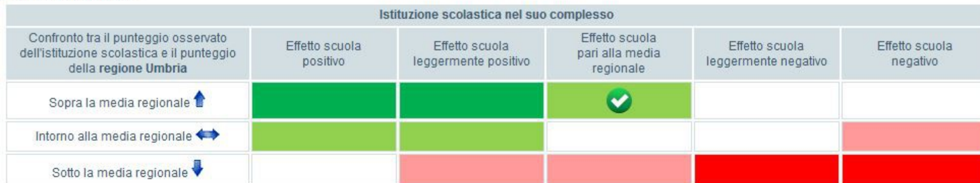
Tavola 9B Matematica