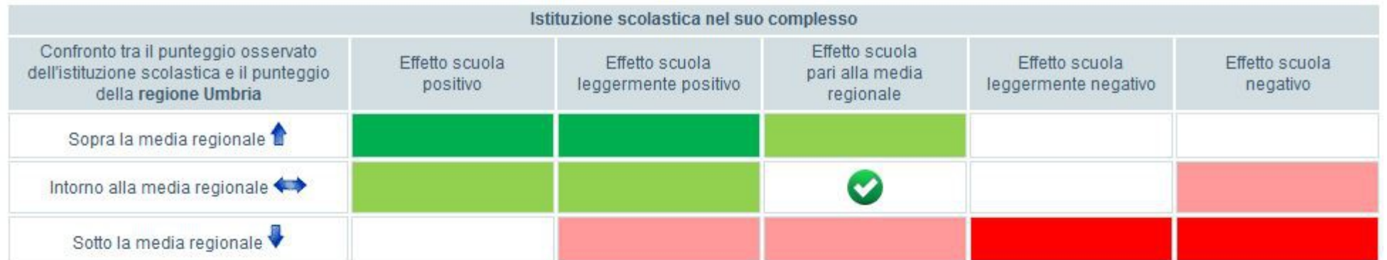
Tavola 9A Italiano